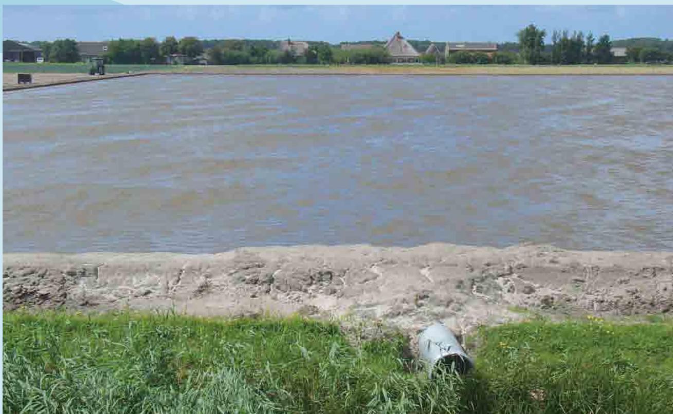
Overloop met lange pijp om dijkdoorbraak te voorkomen

Onderstaande tips komen van bedrijven die al enkele jaren ervaring hebben met het inunderen.